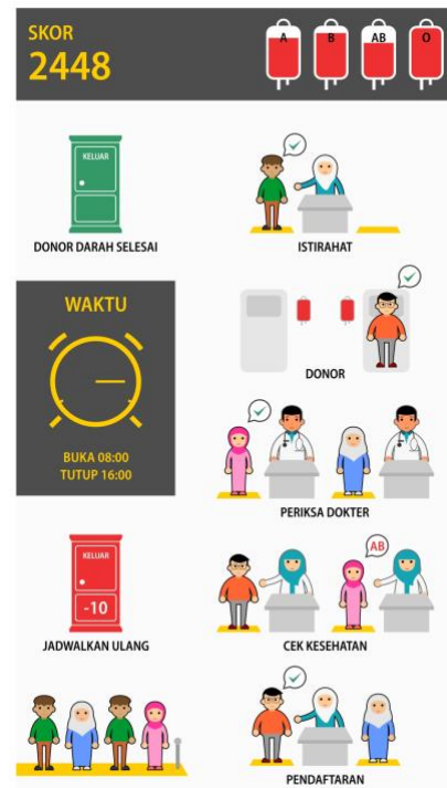
Gambar 3. Antarmuka Proses Permainan

waktu pelayanan yang dimulai dari pukul 08:00 hingga pukul 16:00. Selain itu ilustrasi kebutuhan darah juga dibuat dalam bentuk kantong darah yang terisi oleh darah. Tiap kantong akan terisi penuh apabila telah terisi oleh 10 pendonor. Tiap pendonor dipindahkan dengan teknik drag and drop (menggeser dan meletakkan).